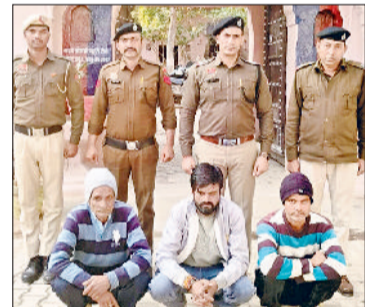
नारनौल। पुलिस गिरफ्त में आरोपी।

डायल 112 पहुंचने के बाद निजामपुर पुलिस भी हरकत में आई और अस्पताल में मौजूद एचसी प्रदीप व अन्य पुलिस कर्मी नारनौल अस्पताल पहुंचे। पुलिस ने घायल की एम्बुलेंस, मृतक का रुक्का तथा अन्य आवश्यक दस्तावेज तैयार किए तथा सवेरा होने पर मंगलवार सुबह नागरिक अस्पताल से शव का पोस्टमार्टम कराया। पुलिस ने शिकायत के आधार पर मामला दर्ज करते हुए जांच शुरू कर दी है।