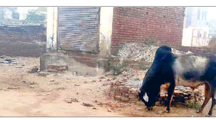
महेन्द्रगढ़। शहर के एक मोहल्ले में खड़े सांड।

लोगों ने प्रशासन से सांडों के आतंक से निजात दिलाए जाने की मांग की है। लोगों का कहना है कि आवारा सांड जानवरों के कारण लोगों को परेशानी का सामना करना पड़ रहा है। बाजार में