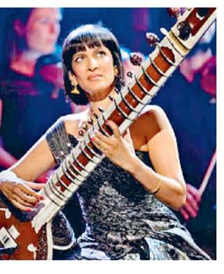
इंस्ट्रूमेंटल एल्बम में शामिल था। इसके साथ ही पर्युजन बैड शक्ति (शंकर महादेवन, जय मैकलॉघलिन, गणेश राजगोपालन और वी. सेतुलिंगम के बैड) को दो नामांकन मिले। उनका लाइव एल्बम माईड एक्सप्लोरेशन बेस्ट ग्लोबल म्यूजिक एल्बम में और ट्रैक शेरीनी