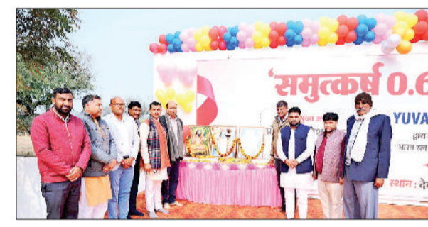
महेन्द्रगढ़। कार्यक्रम में उपस्थित अतिथि।