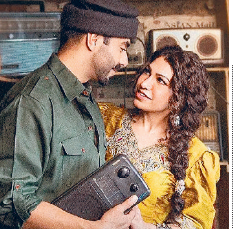
मुंबई। टी-सीरीज ने अपने आधिकारिक इंस्टाग्राम अकाउंट पर गाने की जानकारी देते हुए एक क्लिप शेयर की, जिसके साथ उन्होंने लिखा, थोड़ी सी नाराजगी पर बहुत सारा प्यार। 'निक्की निक्की गल' गाना अब रिलीज हो गया है। गाने की कहानी बहुत प्यारी है। इसमें छोटी-छोटी बातों पर