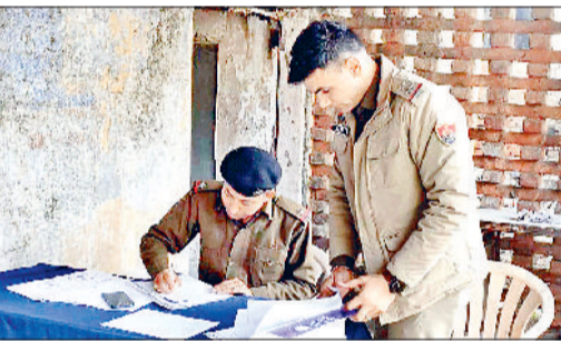
नारनौल। कागजी कार्रवाई करती पुलिस।