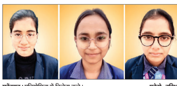
महेन्द्रगढ़। प्रतियोगिता में विजेता बच्चे।

आरआरसीएम पब्लिक स्कूल कनीना के विद्यार्थियों ने खंड स्तर पर आयोजित कानूनी साक्षरता एवं डॉक्यूमेंट्री प्रतियोगिता में शानदार प्रदर्शन किया। इस प्रतियोगिता के अंतर्गत स्लोगन लेखन और डॉक्यूमेंट्री निर्माण जैसी अनेक रचनात्मक गतिविधियां आयोजित की गईं। उल्लेखनीय है कि यह प्रतियोगिता पीएम श्री राजकीय वरिष्ठ माध्यमिक विद्यालय कनीना में आयोजित की गई थी। स्लोगन लेखन प्रतियोगिता में छात्रों ने कानून सबके लिए समान, अधिकार जानो, सुरक्षित रहो जैसे प्रभावशाली नारों