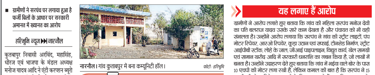
महेन्द्रगढ़। एसडीएम को ज्ञापन देने आए विद्यार्थी।