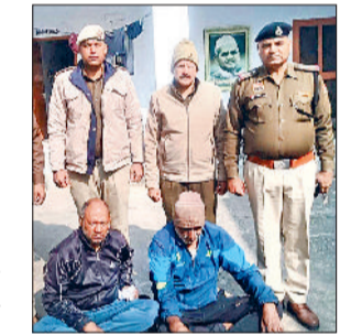
कनीना। पुलिस गिरफ्तार में हथियारोंपित।