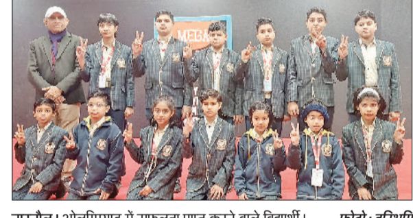
नारनौल। ओलंपियाड में सफलता प्राप्त करने वाले विद्यार्थी।

तहत मेक इन इंडिया, डिजिटल इंडिया, स्किल इंडिया जैसे अभियान के बारे में जानकारी दी। प्रांत संगठन मंत्री संजय कर्वाणें कहा कि भारत सदैव से एक रहा है। हमारे यहां जातिवाद का कभी कोई उदाहरण नहीं रहा है।