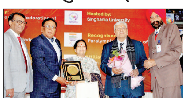
नारनौल। अतिथियों का स्वागत करते हुए।

पंचेरी बड़ी स्थित सिंघानिया विश्वविद्यालय के मारवाड़ इंडोर एरीना में पैरा शोर्बॉल नेशनल फेडरेशन कप 2026 सह ट्रायल सेलेक्शन द्वितीय एशियन पैरा शोर्बॉल चैंपियनशिप का उद्घाटन समारोह आयोजित किया गया। इस तीन दिवसीय राष्ट्रीय प्रतियोगिता का आयोजन पैरा शोर्बॉल फेडरेशन ऑफ इंडिया द्वारा किया जा रहा है, जिसकी मेजबानी सिंघानिया विश्वविद्यालय कर रहा है। उद्घाटन समारोह का शुभारंभ अतिथियों के स्वागत, हाई-टी,